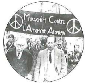
Jean Rostand et Claude Bourdet

Les circonstances historiques de la création du Mouvement contre l'armement atomique (MCAA) au début de l'année 1963 sont aisées à déterminer. Elles relèvent de l'articulation d'un contexte global, planétaire, avec une situation intérieure en France bien caractérisée.