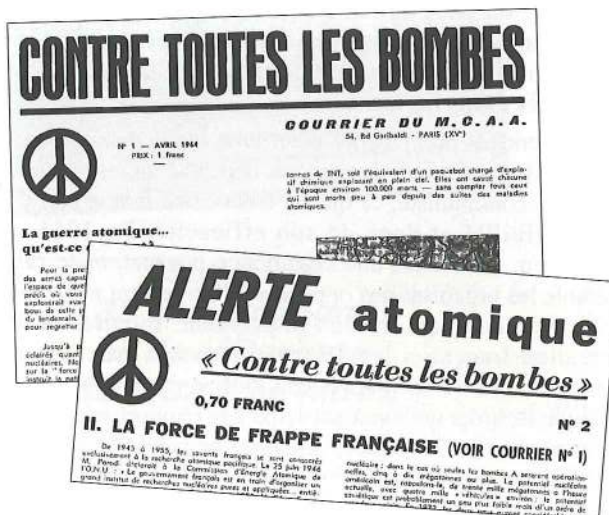
Dès avril 1964, le MCAA se dote d'un organe de liaison, qui, dès le second numéro prend le titre d'Alerte atomique. Au départ bimestriel, ce journal comprenait 6 à 8 pages.

Au bout d'une année d'activité intense, le MCAA compte plusieurs milliers de membres (6 à 7 000). Il possède des groupes organisés dans 48 départements et des groupes en voie d'organisation dans 10 autres. Son symbole est répandu à des milliers d'exemplaires. Il devient, en France comme dans le monde, une référence pour une jeunesse qui aspire à un monde de paix et de réconciliation entre les peuples et entre les hommes, contre l'absurdité de la guerre et de la préparation de la guerre nucléaire qui annihilerait toute une partie de l'humanité et laisserait chez les survivants et leurs descendants des tares inimaginables. En 1963 « on meurt encore à Hiroshima », dit une pancarte du MCAA. La crise des fusées à Cuba en 1962 a montré que cette hypothèse ne relevait pas de l'in vraisemblable. La naissance du MCAA exprime ce refus radical et propose à la fois un programme et des moyens d'action qui entendent répondre à une aspiration profonde, existentielle, de l'humanité menacée par elle-même. ▲