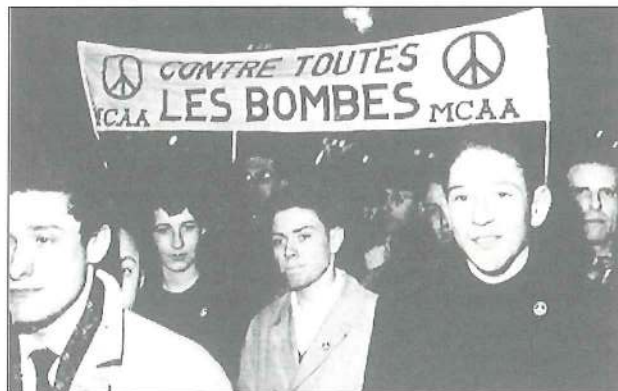
Manifestation silencieuse à Paris le 5 mars 1964 par 150 jeunes du MCAA...

Pendant le conflit algérien, France-Observateur , autour de Claude Bourdet, combat cette nouvelle forme de militarisation qui s'organise. Mais toutes les énergies